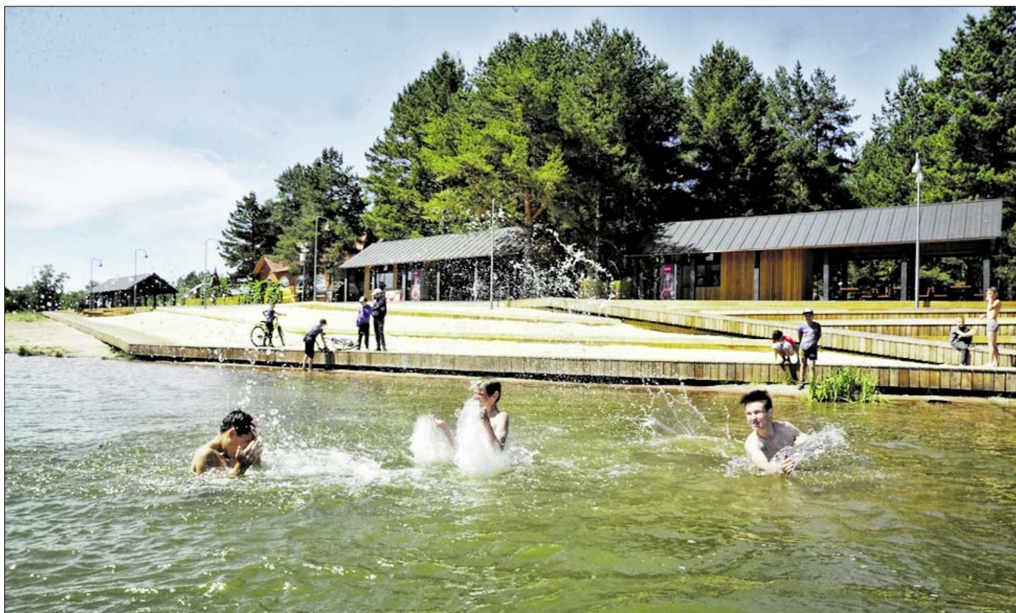
В Парке поющих родников можно искупаться.