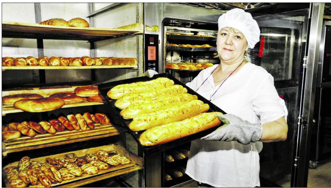
...а местный хлеб даже берут в подарок, когда едут, к примеру, к родственникам в Москву или Питер.