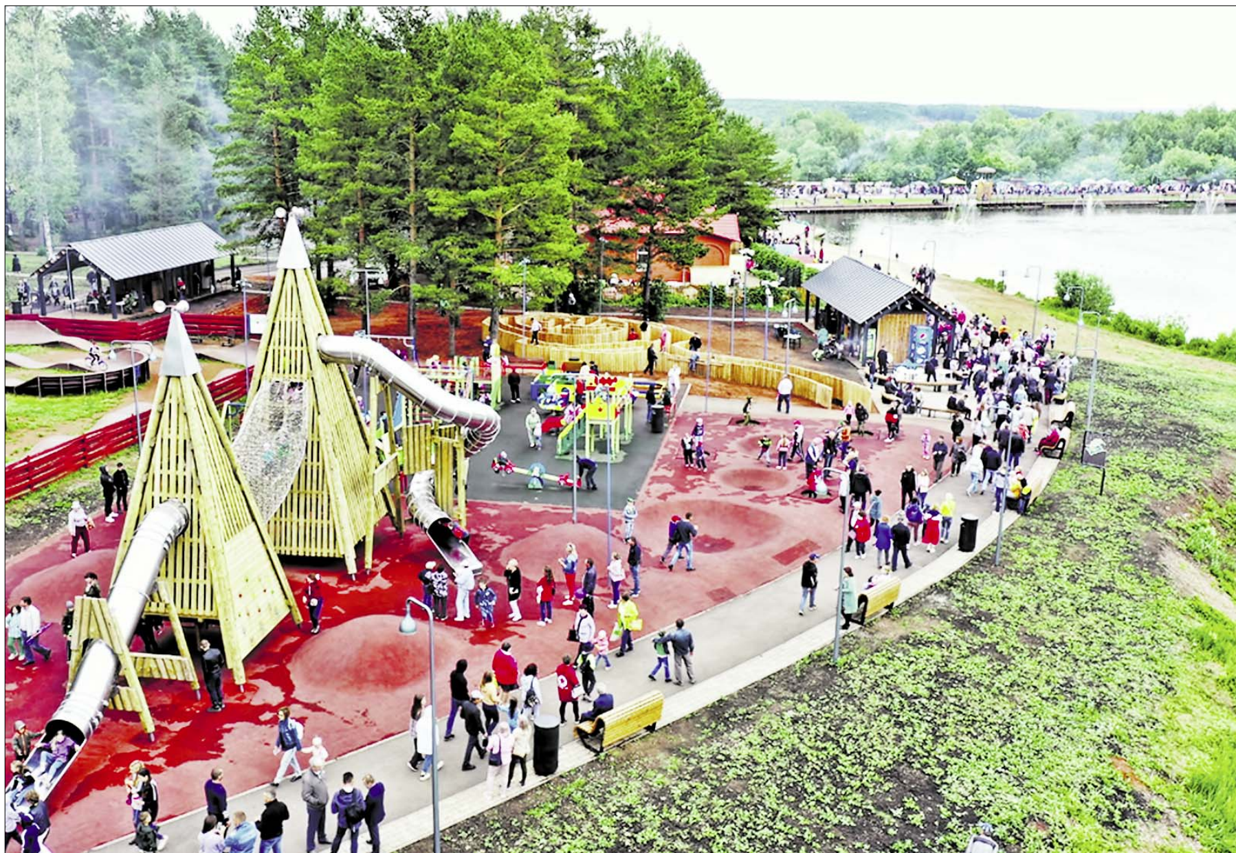
Парк новых родников стал любимым местом отдыха белебеевцев.

Многое что поменялось за эти почти четверть тысячелетия. Неизменным осталось одно —