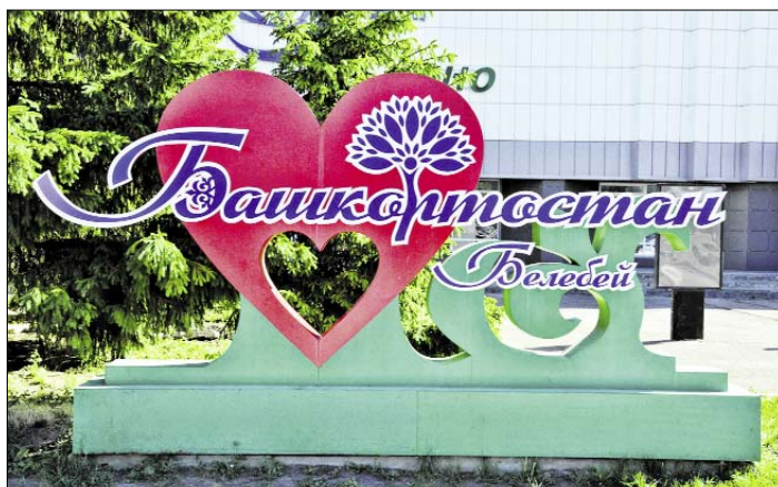
В городе много мест, где можно сделать селфи.

реализация позволит создать порядка 1,1 тысячи рабочих мест. Запустить производство должны к 2024 году.