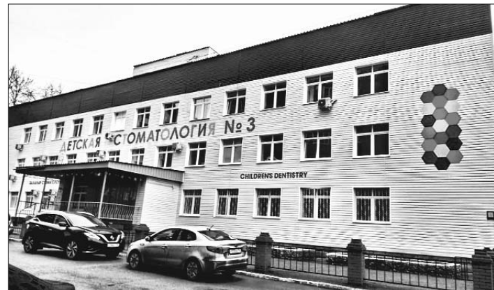
Центральный вход поликлиники-юбилера.

Первая в республике детская стоматологическая поликлиника № 3 города Уфы отмечает полувековой юбилей