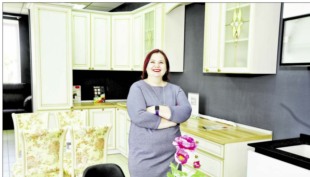
Белебейскую мебель теперь знают и в других городах страны..