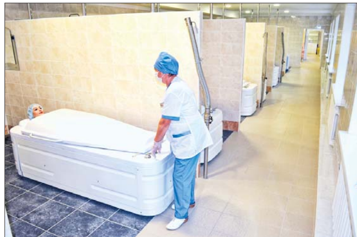
В отделении грязелечения теперь все новое.

года. Кстати говоря, лицензии на использование лечебной грязи и минеральной воды были просрочены, в связи с чем была проведена большая работа по их продлению. Параллельно мы обновили всю документацию и успешно прошли две плановые проверки надзорных органов.