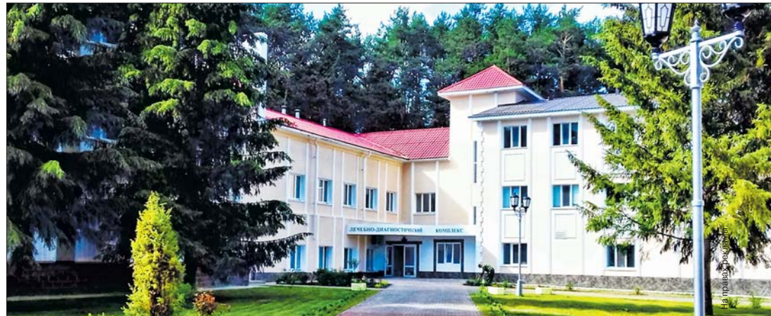
Лечебно-диагностический комплекс после реконструкции не узнать.

— Перемены значительные. Впервые, полностью преобразился лечебно-диагностический комплекс: пока лечение не отпуская, мы сделали там масштабную реконструкцию. От прежнего ЛДК, по сути, остались только стены, а все остальное сделано заново: заменены все инженерные системы, обновлен фасад, перекрыта крыша, а самое главное, появился еще один полноценный этаж, что позволило внедрить новые медицинские услуги и создать дополнительные рабочие места. Если раньше лечебные кабинеты располагались без всякого порядка, то теперь весь лечебный блок мы систематизировали и организовали отделения так, как это должно быть. Заменяли практически все медоборудование, которое имело 96 процентов износа. Сделали полный капитальный ремонт грязезащиты и отделения водоподготовки, завезли свежую грязь, которой хватит на полтора