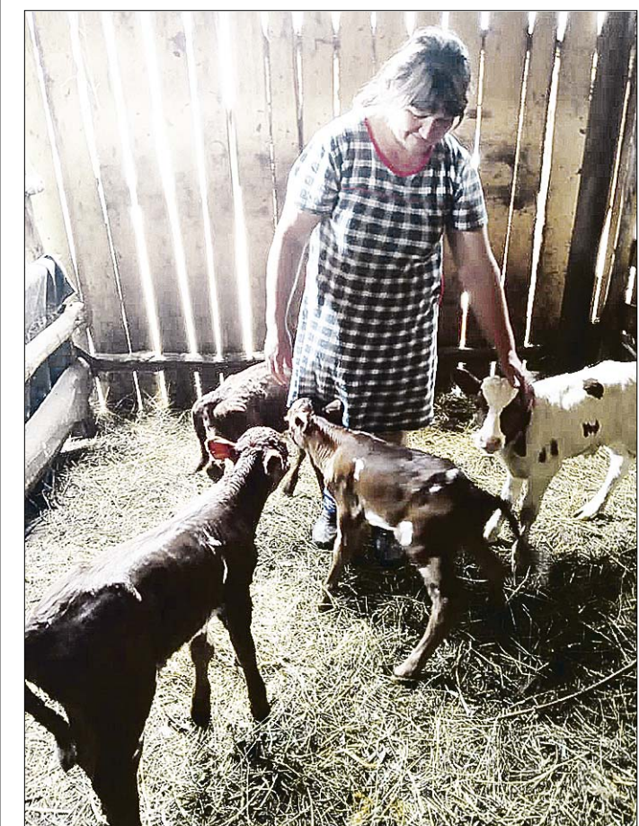
Четверо малышей друг от друга не отходят.