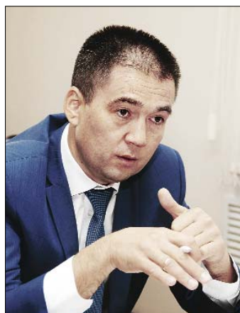
Глава администрации города и района Азат Сахабиев.

В доминирующей сфере, в сфере промышленности, предприятиями отгружено продукции на сумму около 21 миллиарда рублей. Реальный сектор экономики чутко реагирует на любые негативные внешние факторы. Поддержка предприятий в таких